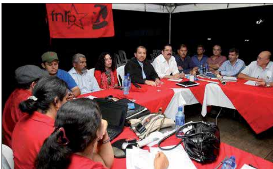
La dirigencia del FNRP reunida en Managua con Daniel Ortega

No obstante, uno de los enormes errores de los dirigentes fue el de plegarse a las intenciones de Zelaya, que por cierto pasaban por su restitución a través del diálogo y no por la derrota de Michelletti a través de insurrección y la huelga general. La falta de independencia de la dirección del frente condicionó la orientación política de la población en resistencia, por un lado nos encontrábamos con amplios sectores que avanzaban sobre las intenciones de la dirección y que eran frenados por el "pacifismo", mientras la policía y el ejército arremetían fuertemente con la población civil. Empero, el error político de la dirección del Frente y de Zelaya fue el de creer en los tramposos