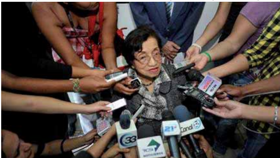
La Ministra de Salud, María Isabel Rodríguez, tiene experiencia en la represión contra el SETUES

El PSOCA llama a todos los empleados públicos de la salud a trabajar por la unidad de los empleados públicos de salud y los ISSS; a la organización y sindicalización de los empleados de la salud que se desempeñan a nivel privado,