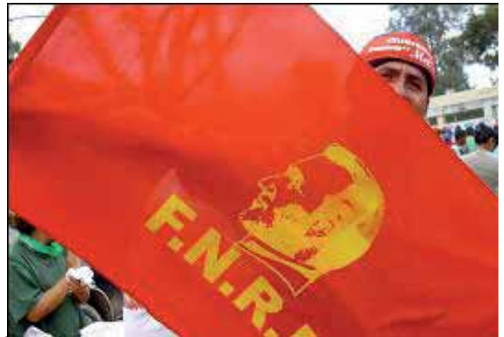
Los repliegues del FNRP (Pág 7)

24 DE OCTUBRE DE 1929: SE INICIA LA GRAN DEPRESIÓN