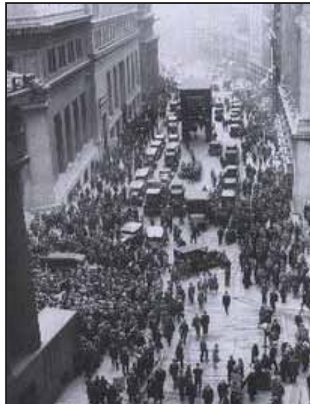
El "jueves negro" frente a la bolsa de valores de Nueva York

El jueves 24 de Octubre se inicia una carrera que no tendría fin en casi una década. Los rumores, que se venían gestando desde el mes de marzo toman fuerza, la bolsa de valores está sobrevalorada y los precios en que se cotizan las acciones, valen mucho menos de lo que el mercado les asigna, es decir, hay una burbuja especulativa. El pánico se apoderó de los inversores burgueses, los especuladores que habían comprado acciones a crédito, se vieron forzados a venderlas inminentemente, sufriendo colosales pérdidas para intentar devolver los préstamos que los bancos ya no les renovaban. Cuentos dignos de una novela se verían ese día, cuando muchos burgueses e inversores, se arrojaban de los rascacielos de Nueva York, incapaces de afrontar las enormes pérdidas económicas que había provocado su especulación, no podían soportar las pérdidas que los llevarían a la ruina, o mejor dicho, llevar la vida de los obreros que tanto habían explotado.