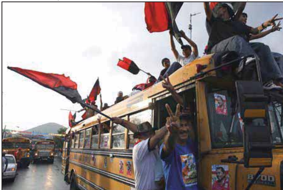
Desde el gobierno, el FSLN ha fortalecido su aparato electoral

los partidos de oposición, y un 16, 2% manifestó confianza hacia los mismos. El FSLN apareció con un nivel de confianza del 49,1%, algo realmente inaudito.