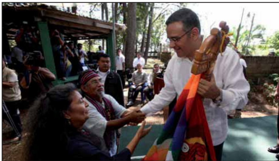
Mauricio Funes pretende congraciarse con los pueblos originarios

"Esos gobiernos oligárquicos, defensores del privilegio, fueron los que cortaron las alas del pueblo y quisieron robar sus ilusiones...y agregó que, opuesto a ellos, hoy se debe optar por ser profetas de la unidad, de la hermandad, de la convivencia y la paz..."