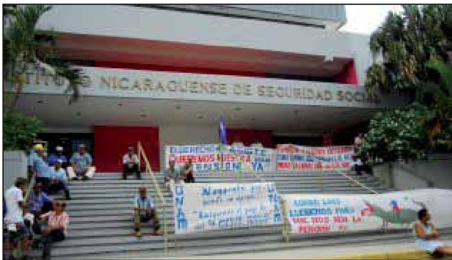
Los ancianos libran una dura lucha por las pensiones

Desde el Partido Socialista Centroamericano (PSOCA) , hacemos un llamado a toda la clase trabajadora y a la sociedad en general que dejen de ser apáticos a estas situaciones que nos afectan a todos, y unámonos en esta lucha por los derechos de los ciudadanos. Emplazamos al gobierno del Frente Sandinista de Liberación Nacional (FSLN) a tomar cartas en el asunto y dar una respuesta satisfactoria a las demandas de la UNAM, así como reformar la Ley a favor del trabajador, mejorando la pensión de jubilación y entregando una pensión promedio o basada en el salario mínimo a aquellas personas que no lograron cotizar las 750 semanas que establece la ley. ■