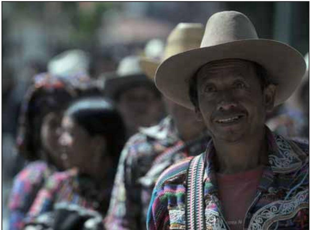
Campesinos e indígenas guatemaltecos marcharon el 20 de Octubre

Este 20 de octubre hacemos un llamado a la unidad de las organizaciones campesinas, sindicales, indígenas, estudiantiles y populares para que juntos luchemos por las demandas más urgentes de los oprimidos: Defensa del territorio contra la minería y las hidroeléctricas;