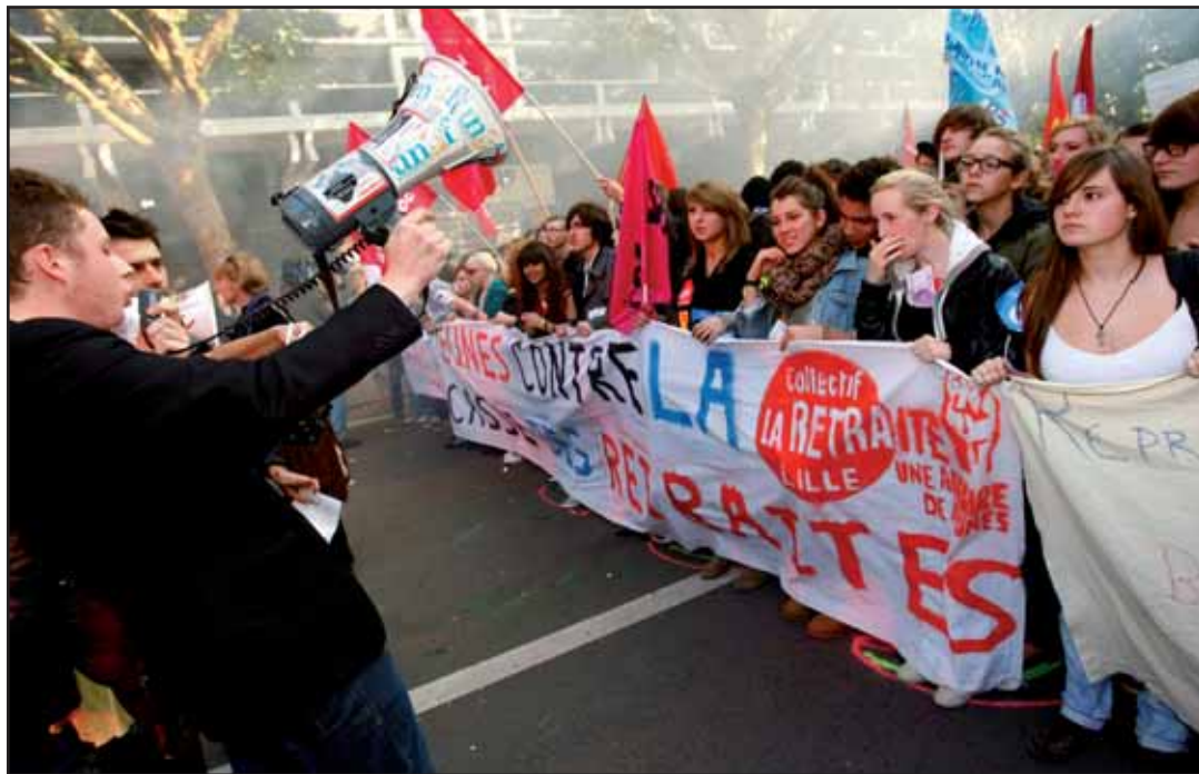
Los jóvenes franceses se han incorporado a lucha, como ocurrió en 1968

En Inglaterra, el gobierno también denominado socialista ha realizado un enorme recorte en los puntos expuestos anteriormente. Este recorte, el más grande desde la segunda guerra mundial, busca destruir lo que el gobierno de la Thatcher en los ochentas no habría podido completar. En los próximos 5 años, medio millón de empleos del sector público se perderán,