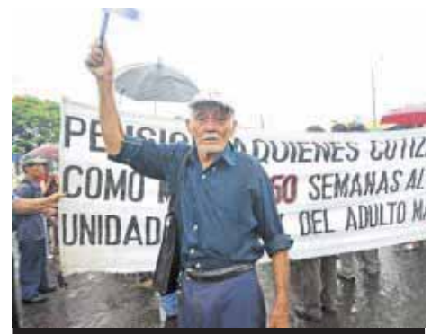
Gobierno de Nicaragua viola derechos del Adulto Mayor (Página 19)