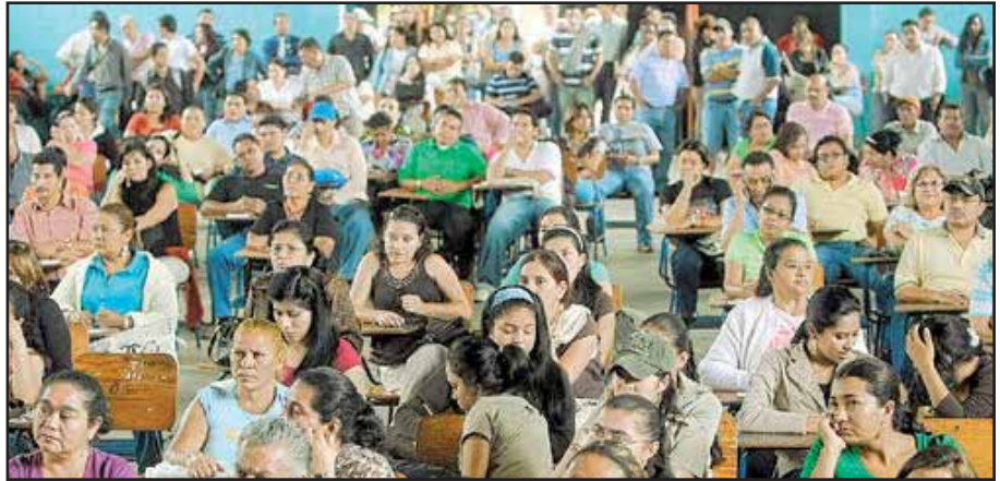
Nuevamente el magisterio tuvo que moviliarse por la defensa de sus intereses

El Sindicato de Trabajadores del INPREMA (SITRAINPREMA) exigió en el mes de septiembre que se le cumpliera con el contrato colectivo firmado en el 2009 durante el gobierno de facto. Es así como a mediados de septiembre los representantes del gobierno y de los 5 colegios magisteriales exceptuando el COPEMH, firman un aumento selectivo a empleados del INPREMA. La posición del COPEMH es no aprobar ningún aumento mientras no se cumplan los puntos acordados en el acta, dejando bien claro que no se oponen a un aumento para los empleados con bajos salarios.