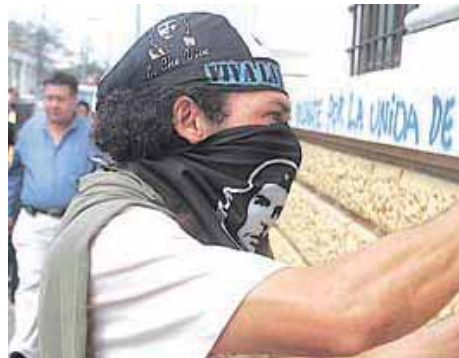
Marcha del 20 de Octubre en Guatemala. (Página 16)