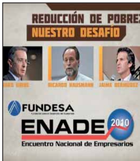
El imperialismo y la burguesía son los causantes de la pobreza

La inversión social de calidad lo que nos propone es mejorar la cobertura y la calidad educativa que si bien es una meta correcta, la idea es formar capacidades para ser mano de