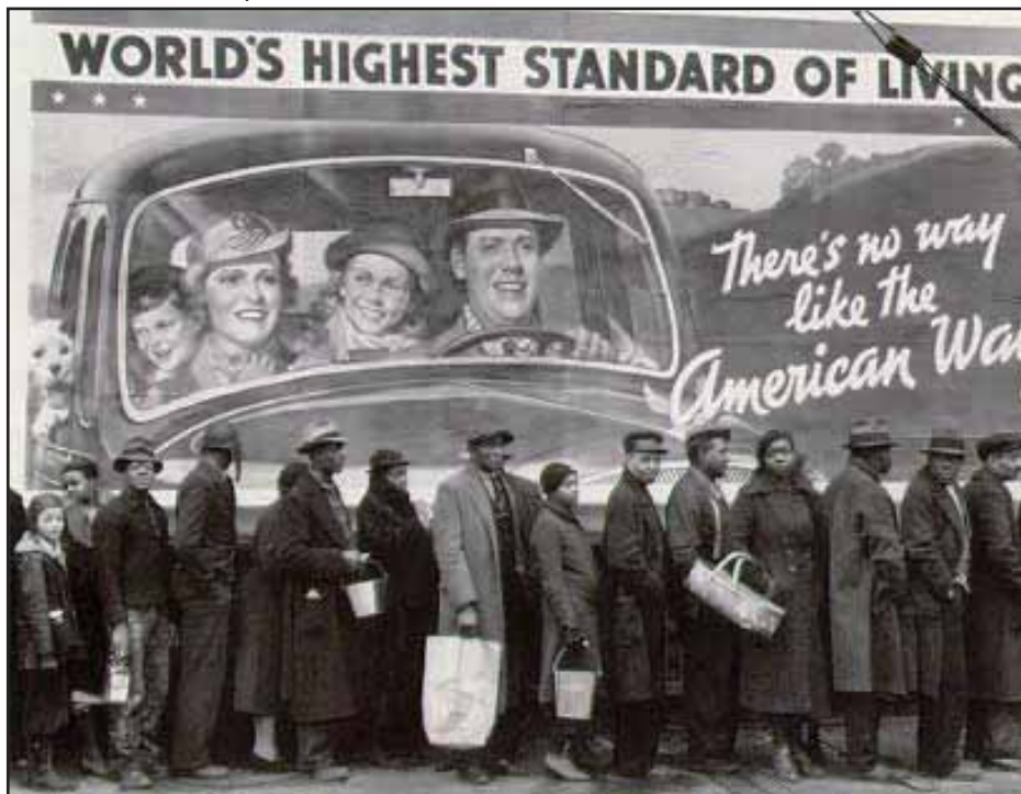
Filas de desempleados: el derrumbe del "sueño americano"

década del treinta, los países imperialistas como EUA, Alemania, Japón entre otros, comenzaron a tener indicios de reactivación económica. Pero este flujo de capital comienza a surgir producto de la industria armamentista, desde 1936 Trotsky advertía: "bajo la inspiración, esta vez, de Roosevelt, un gasto anual de más de mil millones de dólares para la preparación militar y naval, una suma muy superior a todas las de los periodos precedentes. Por el