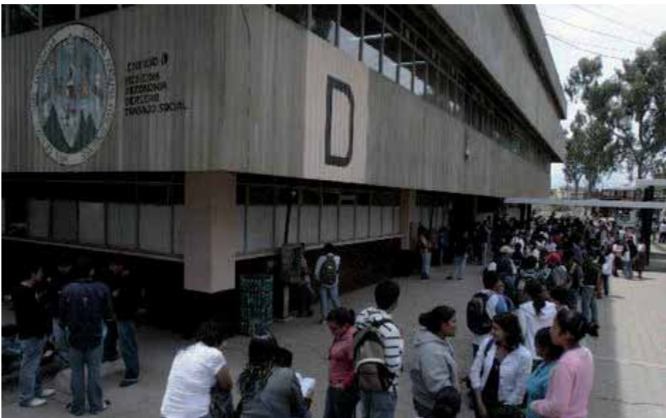
Instalaciones del CUNOC

Desde el Partido Socialista Centroamericano (PSOCA) exigimos la inclusión de las asambleas permanentes a la mesa multisectorial que propondrá una metodología para el congreso de reforma, pues ha sido un sector no tomado en cuenta históricamente que está demostrando su inconformidad, así también hacemos el llamado al estudiante apático a tomar conciencia e incorporarse a esta histórica lucha. ■