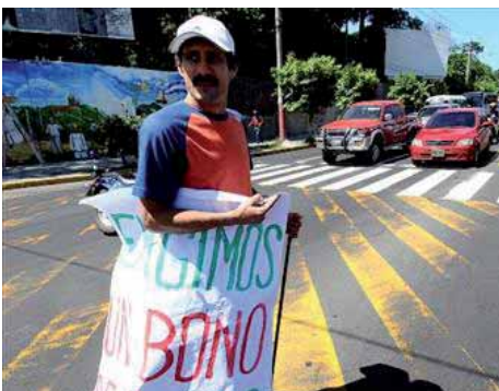
Lucha de los trabajadores de la salud en El Salvador (Páginas 8 y 9)

LUCHAS DE RESISTENCIA OBRERA EN FRANCIA: ¡¡UNIFICACIÓN DE LAS HUELGAS GENERALES EN TODA LA UNIÓN EUROPEA!!